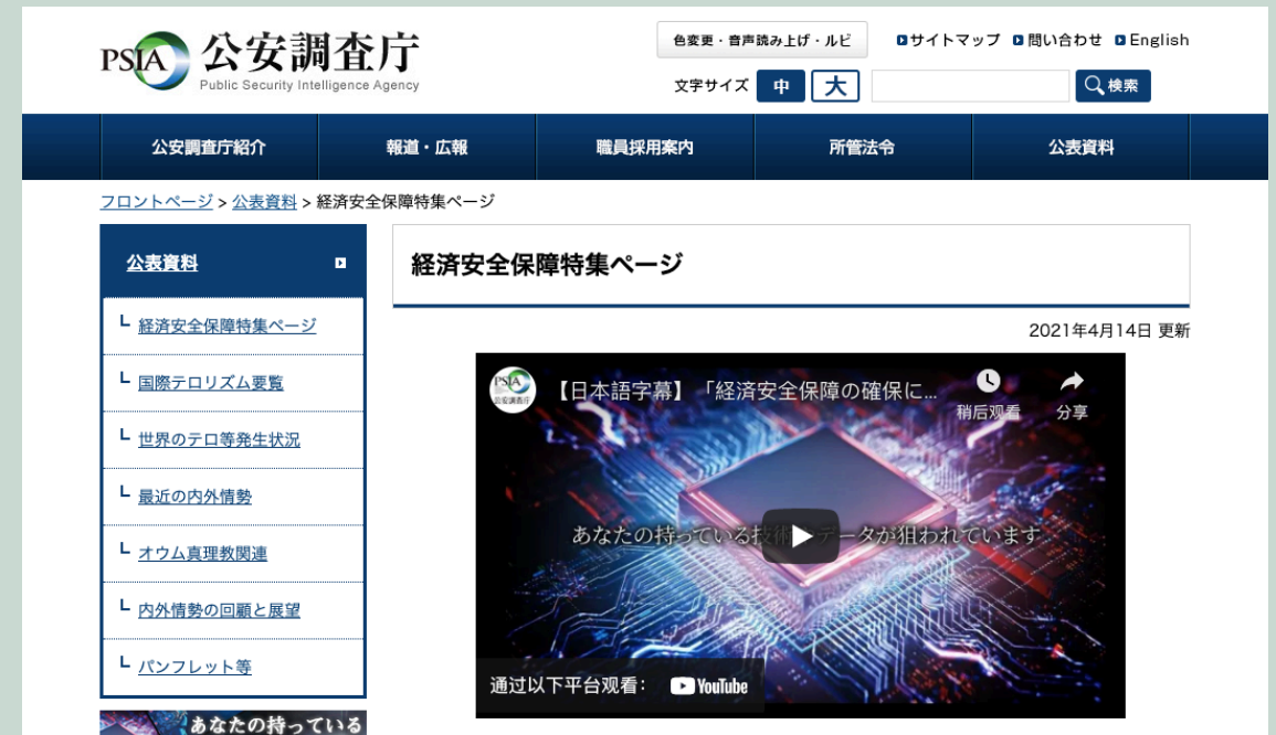
经济安全保障特色网页

然而，过度的政策对民企会产生多度负担。为了避免出现损害自由贸易的过度反应，日本政府也非常重视国家利益和企业和其利益相关者利益的平衡。特别是日本外交部相比公安调查厅更加重视自由贸易。